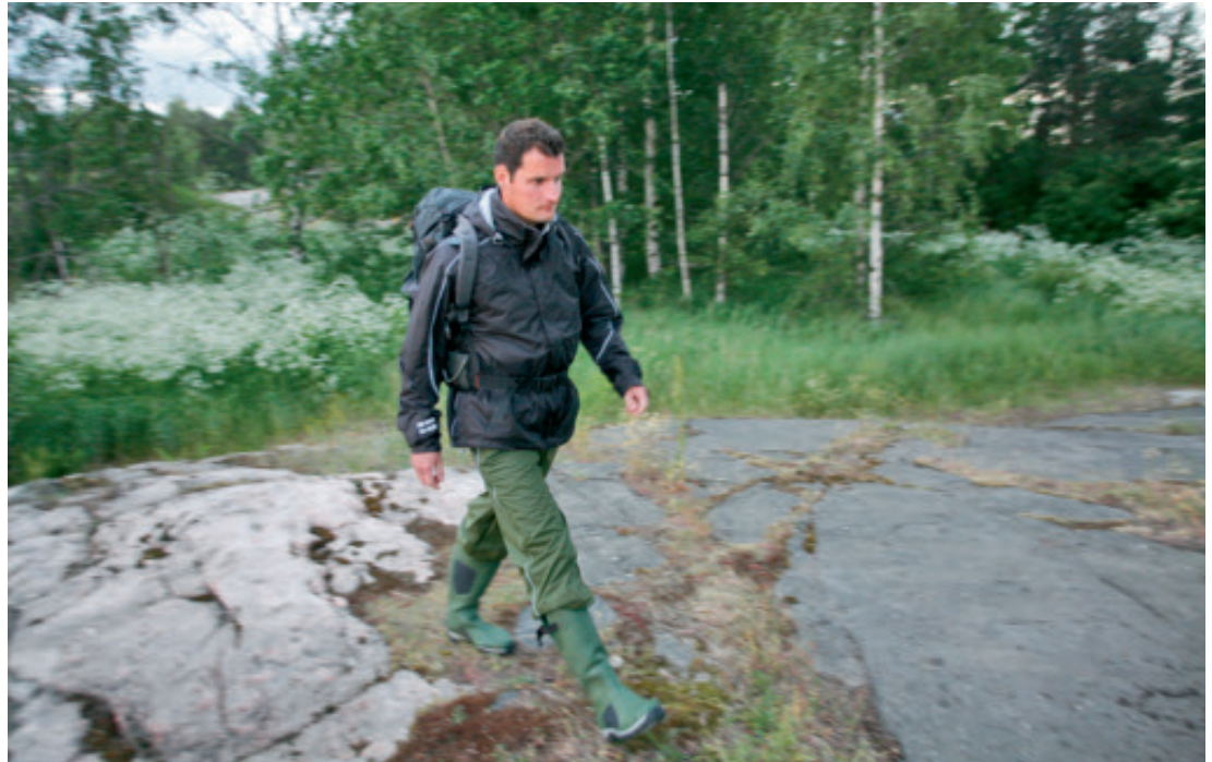
Tretornin sadeasut hengittävät perinteistä umpitiivistä sadeasua paremmin. Kuvan Heavy Weight Rain Pant on mitoitukseltaan niin väljä, että sen voi vetää vaikka farkkujen päälle. Takki on ohuesta nylonista tehty Light Weight Rain Jacket.