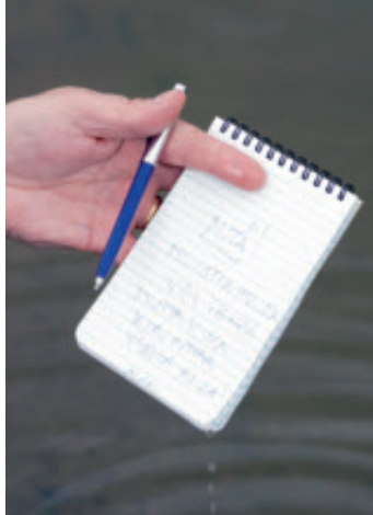
Muistiinpanoja voi nyt kirjata myös veden alla.

Säänkestävälle paperille printattu kartta kesti uimareissun, mutta tavalliselle printatusta ei olisi enää ollut maastossa iloa.